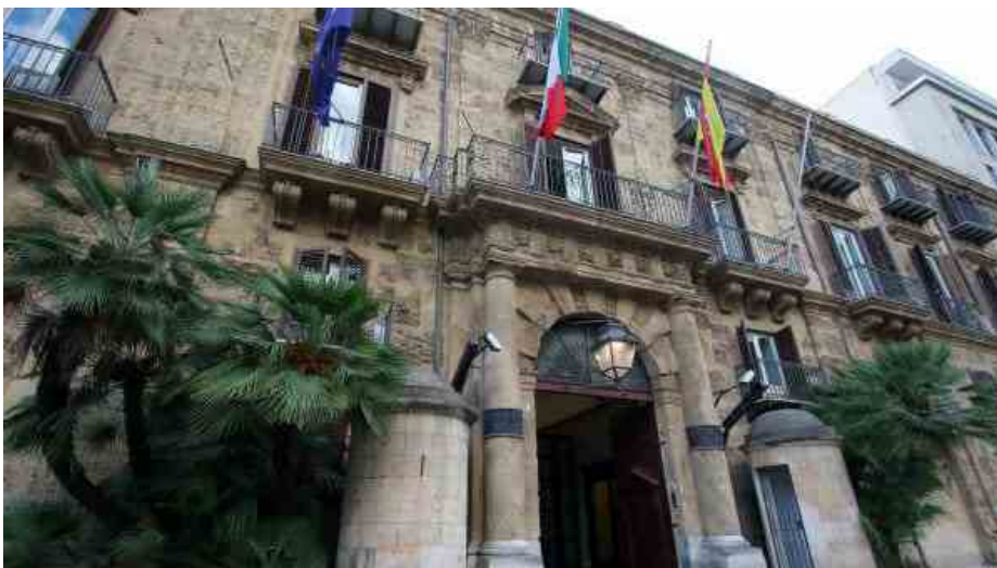
Palazzo d'Orleans, sede della presidenza della Regione Siciliana

"Basta con i ritardi e le inefficienze. Vigileremo sull'applicazione delle norme e dei regolamenti". A dirlo sono gli industriali siciliani, che hanno inviato una nota con gli auguri di buon lavoro ai nuovi direttori regionali , allegando però un documento con le proposte per lo sviluppo della Sicilia. Lo stesso documento redatto da Sicindustria è stato già presentato al governo regionale e all'Ars.