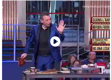
Mossa sbagliata, disastro in diretta per Amadeus: si strappano i pantaloni, fuori tutto